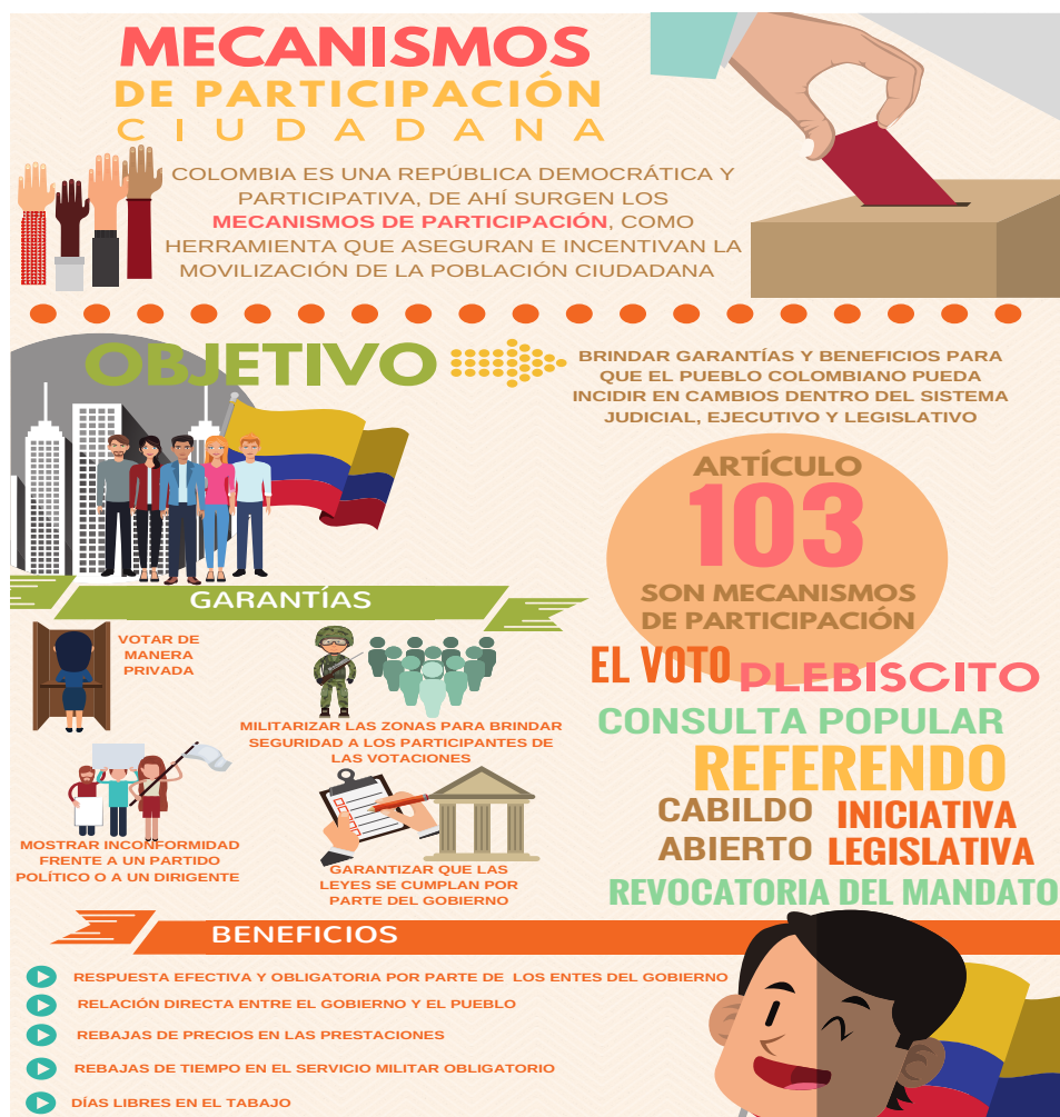
Imagen 2: Mecanismos de participación ciudadana.

el Sí sobre el No (4'536.992 millones de votos requeridos) para ganar la elección. (Ver imagen 2)