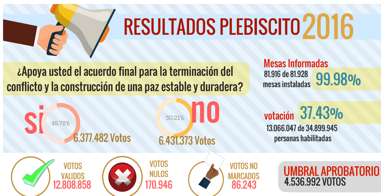
Imagen 3: Resultados parciales del plebiscito